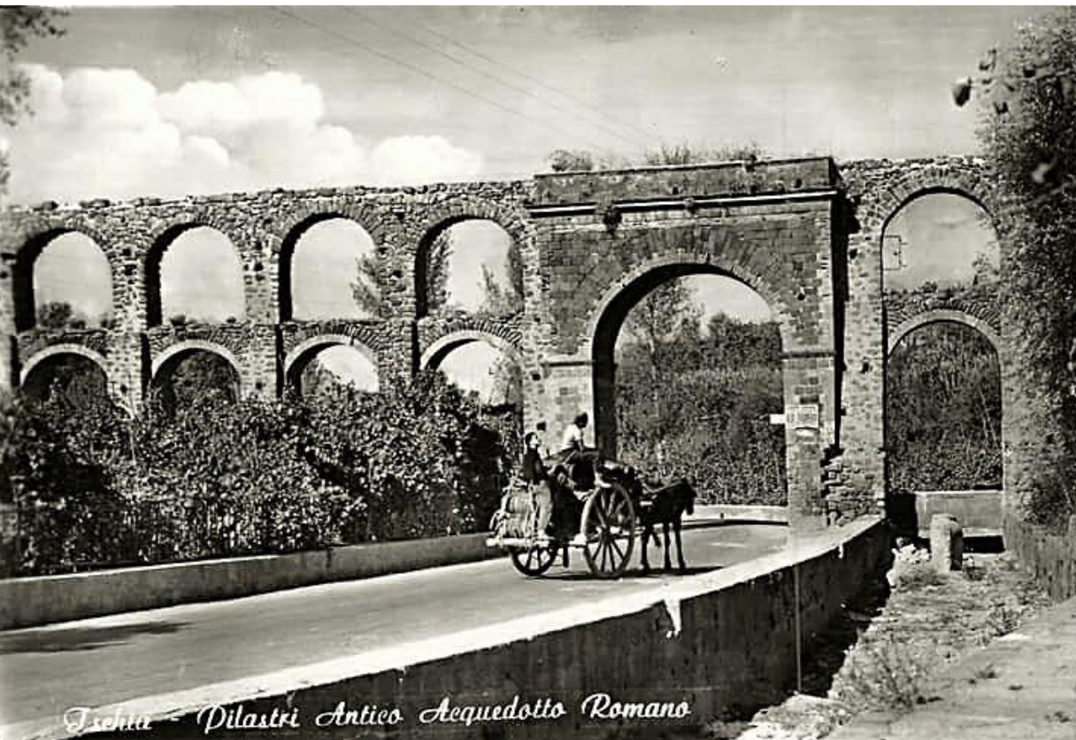
Ischia - Pilastrino Antico Acquedotto Romano

En raison du bradyséisme, Ischia perd une importante source d'eau. Pour faire face à la grave pénurie d'eau, de nouvelles sources sont recherchées et un aqueduc coûteux, payé par de nouvelles taxes, est créé.