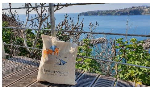
Il Muro dei Migranti – Marzo 2022

Rende omaggio a questi uomini e donne, al loro coraggio e alla loro determinazione, per tracciare un nuovo destino per loro e le loro famiglie emigrando in altri paesi. I nomi dei nostri antenati migranti sono incisi su una targa apposta e visibile sul muro fisico, completato da un muro digitale, rendendo le loro storie individuali accessibili online.