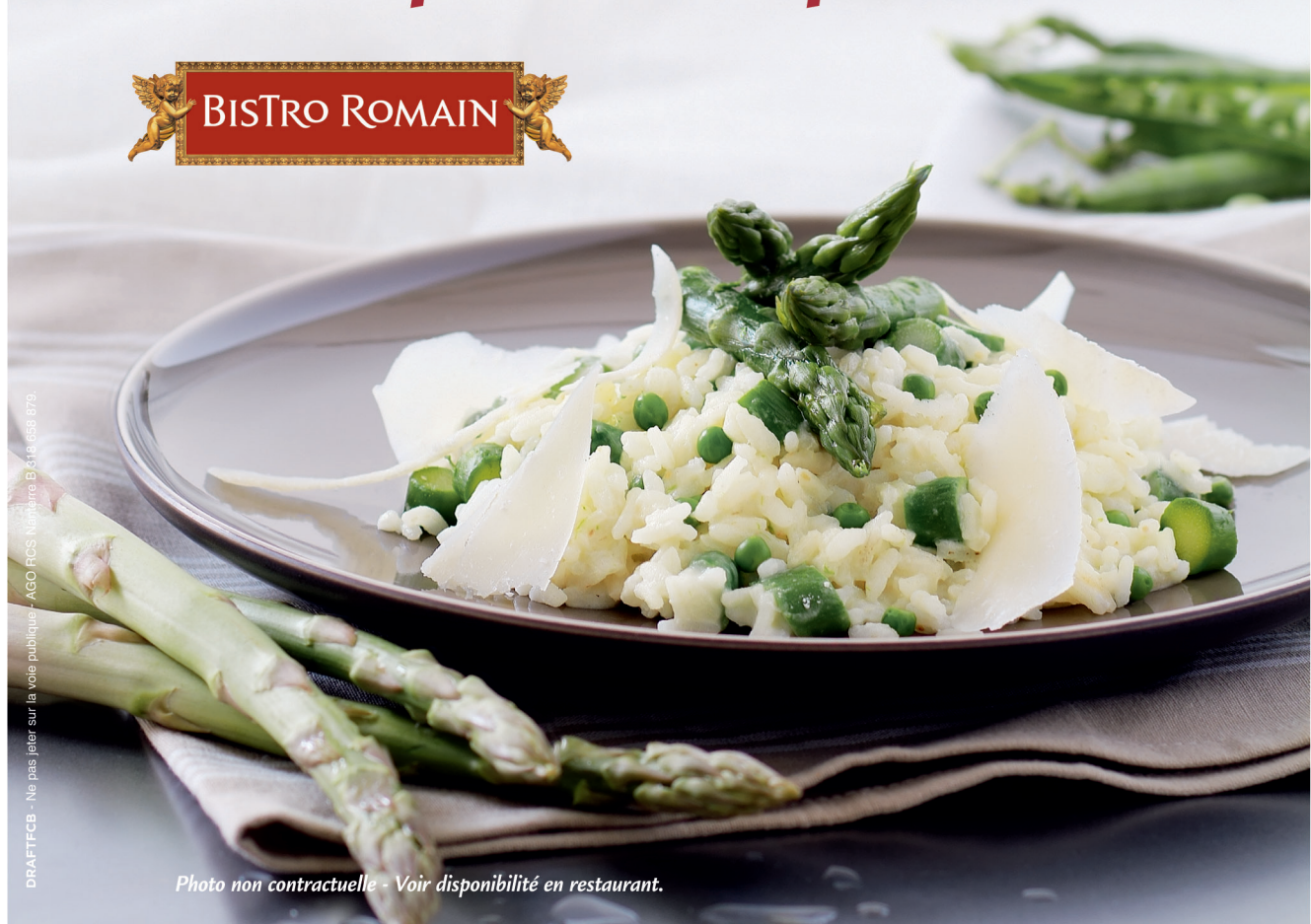
Photo non contractuelle - Voir disponibilité en restaurant.