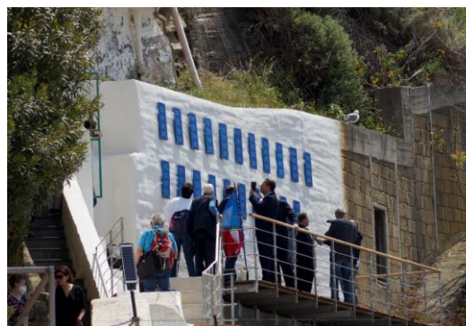
Inaugurazione del Muro dei Migranti Martedì 3 maggio 2022

Il Muro dei Migranti, affacciato sul porto della Corricella a Procida, rende omaggio a questi uomini e donne, al loro coraggio e alla loro determinazione, per costruire un nuovo destino emigrando in altri paesi. I loro nomi sono incisi su targhe e le loro storie individuali sono accessibili online sul Muro digitale.