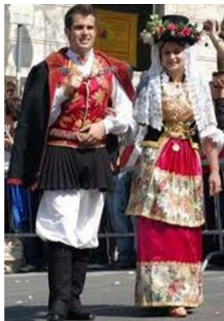
Mariage à Cagliari (Sardaigne)